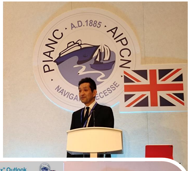
写真(右, 下): 森橋 技術参事官の講演

AGA翌日の技術セミナーでは、幅広いテーマからなる14編の講演が実施されました。日本からは森橋 国土交通省大臣官房技術参事官による「日本の洋上風力発電の概要: Overview of Offshore Wind Power in Japan」と題する講演が行われました (アジアからの講演はこの1編だけであった)。