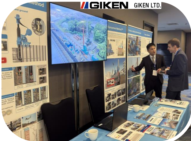
← ↓（株）技研製作所の出展

日本からはPIANC-Japan団体会員である（株）技研製作所さまの出展がありました。