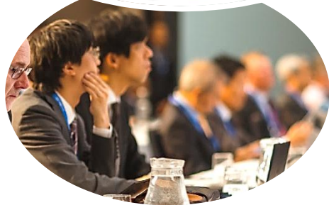
↑AGA会場 右上, 右下 (日本代表团) →