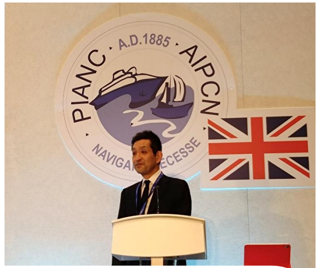
写真(右, 下): 森橋 技術参事官の講演

AGA翌日の技術セミナーでは、幅広いテーマからなる14編の講演が実施されました。日本からは森橋 国土交通省大臣官房技術参事官による「日本の洋上風力発電の概要: Overview of Offshore Wind Power in Japan」と題する講演が行われました (アジアからの講演はこの1編だけであった)。