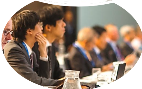
↑AGA会場 右上, 右下 (日本代表团) →