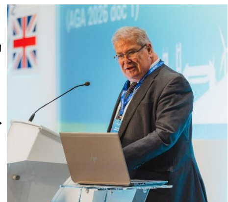
エステバン本部 会長報告 →