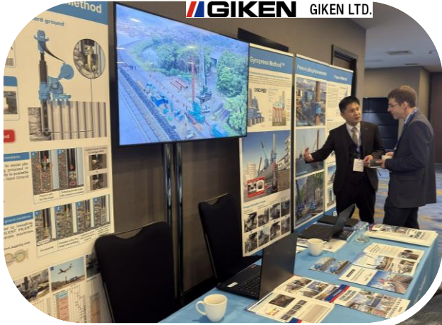
← ↓（株）技研製作所の出展

日本からは、PIANC-Japan団体会員である（株）技研製作所さまの出展がありました。