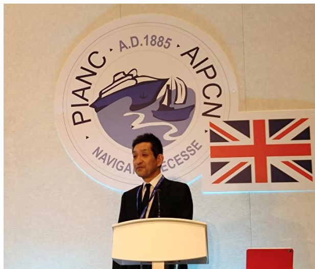
写真(右, 下): 森橋・技術参事官の講演

AGA翌日の技術セミナーでは、幅広いテーマからなる14編の講演が実施されました。日本から森橋 国土交通省大臣官房技術参事官が「日本の洋上風力発電の概要：Overview of Offshore Wind Power in Japan」と題する講演を行いました（アジアからの講演はこの1編だけであった）。