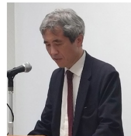
水産庁漁港漁場整備部 的野事業課長ご挨拶