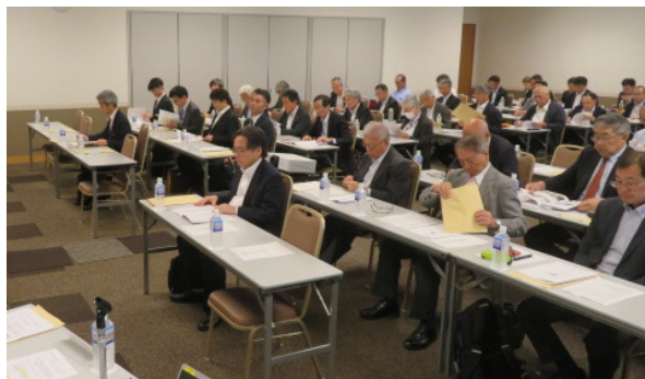
通常総会・活動報告会の会場