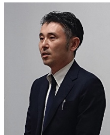
国土交通省港湾局 金丸国際企画室長ご挨拶