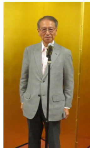
写真：意見交換会の会場（左上，右上，左下）