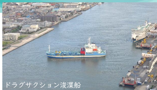
ドラグサクシオン浚渫船