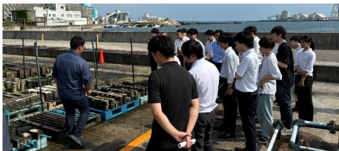
長期暴露試験施設の見学・説明の様子