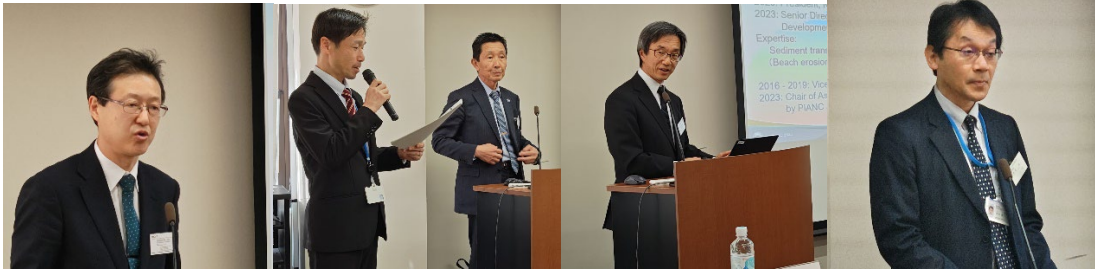
西村港湾局技術参事官