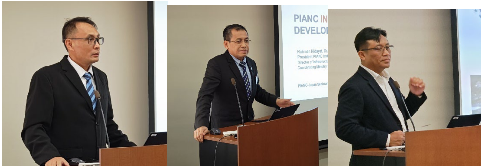
アントニー海運総局長